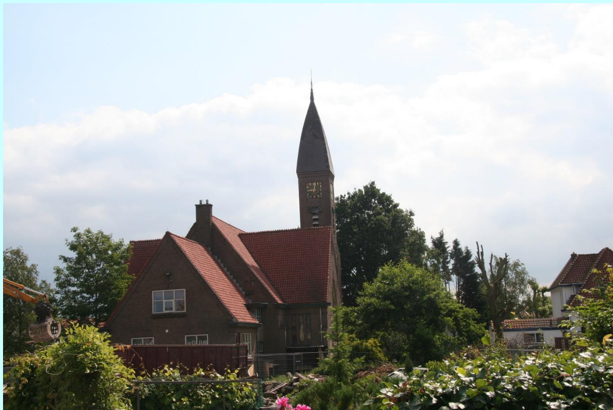
Amstelhoek, zicht op voormalige Gereformeerde kerk aan de Piet Heinlaan.

Lid worden van onze vereniging kan door een e-mailbericht met vermelding van naam en adres te sturen naar administratie@proosdijlanden.nl . U kunt ook uw gegevens, voorzien van uw handtekening, opsturen naar: Historische Vereniging De Proosdijlanden, Croonstadlaan 4a, 3641 AL Mijdrecht.