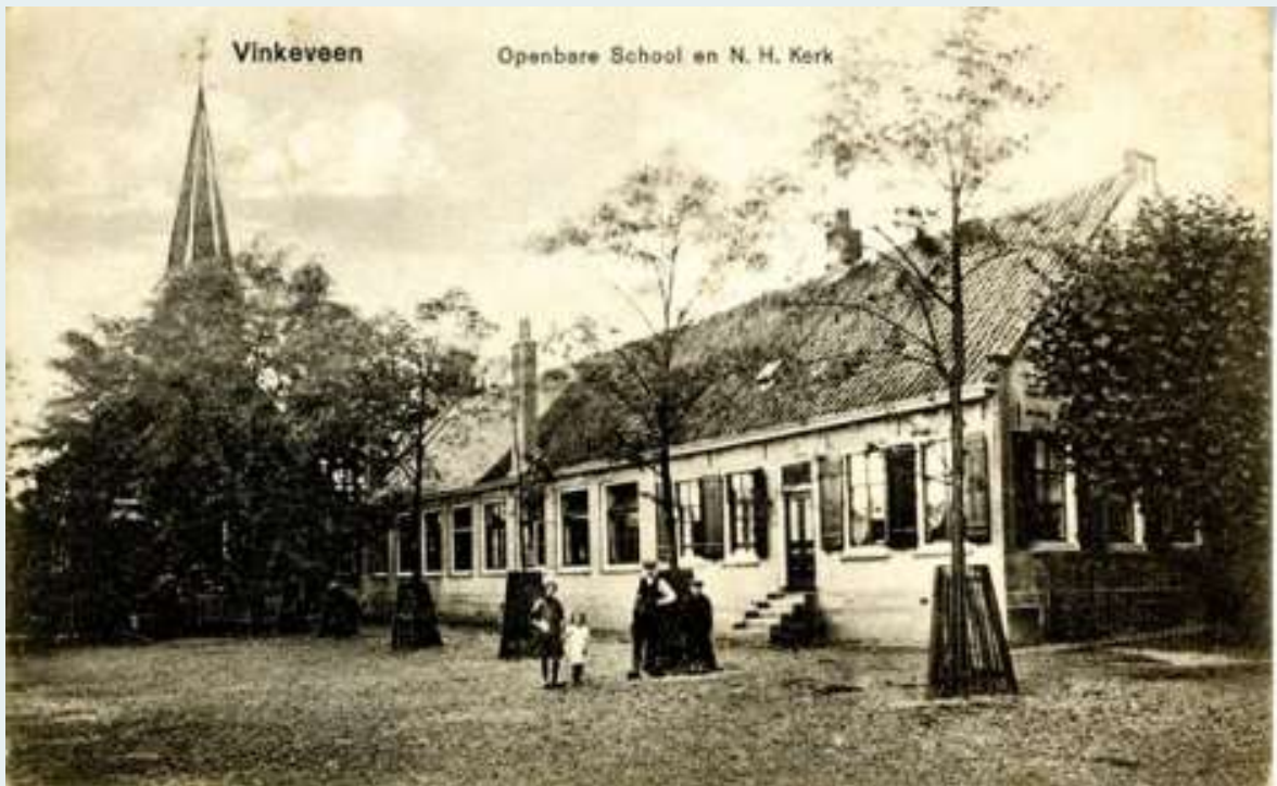
Vinkeveen, Hervormd Verenigingsgebouw.....