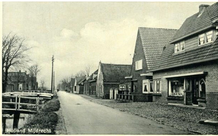
Twee ansichtkaartfoto's uit de 'collectie Gille': Hervormde Kerk en Hofland Mijdrecht

Lid worden van onze vereniging kan door een e-mailbericht met vermelding van naam en adres te sturen naar administratie@proosdijlanden.nl . U kunt ook uw gegevens, voorzien van uw handtekening, opsturen naar: Historische Vereniging De Proosdijlanden, Croonstadtlaan 4a, 3641 AL Mijdrecht.