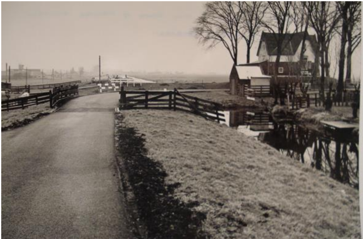
De Hoef: Hoge Dijk

Wilt u reageren dan kunt u deze e-mail beantwoorden.