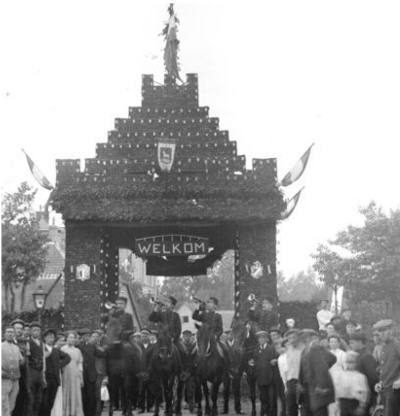
Bozenhoven – Driehuis 1913, Erepoort geheel uit turf opgebouwd