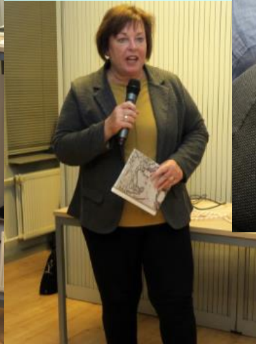
Presentatie en ontknoping van het VOC-boekje