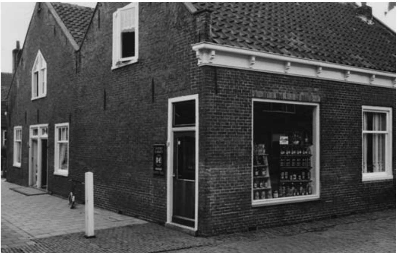
De winkel van Jo en Bertha Wintershoven in de Kerkstraat van Abcoude

Iedere vaste klant had een boodschappenboekje waarin de wekelijkse boodschappen werden opgeschreven. Naast kruidenierswaren verkocht Jo ook verse kaas. Deze werd geleverd door de plaatselijke kaashandel van "De Lange". Op zaterdag werden de boodschappen thuisgebracht, of konden afgehaald worden in de winkel. Na betaling zette Jo een grote paraaf door de lijst van boodschappen. Ook werden vanuit een glazen