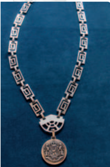
De ambtsketen van De Ronde Venen

In 1976 werd de ambtsketen van Mijdrecht voor een bedrag van 900 gulden veranderd. Het bleek namelijk