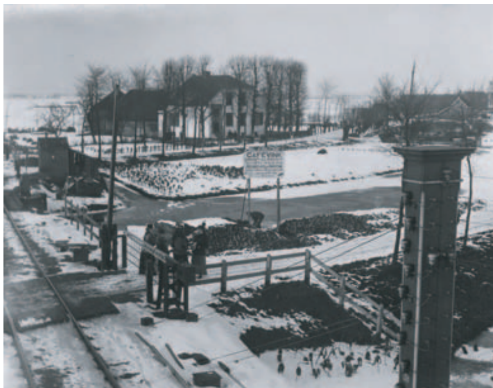
Groot Rome gezien vanuit het seinhuis

Het gemeentewapen en de ambtsketen van De Ronde Venen