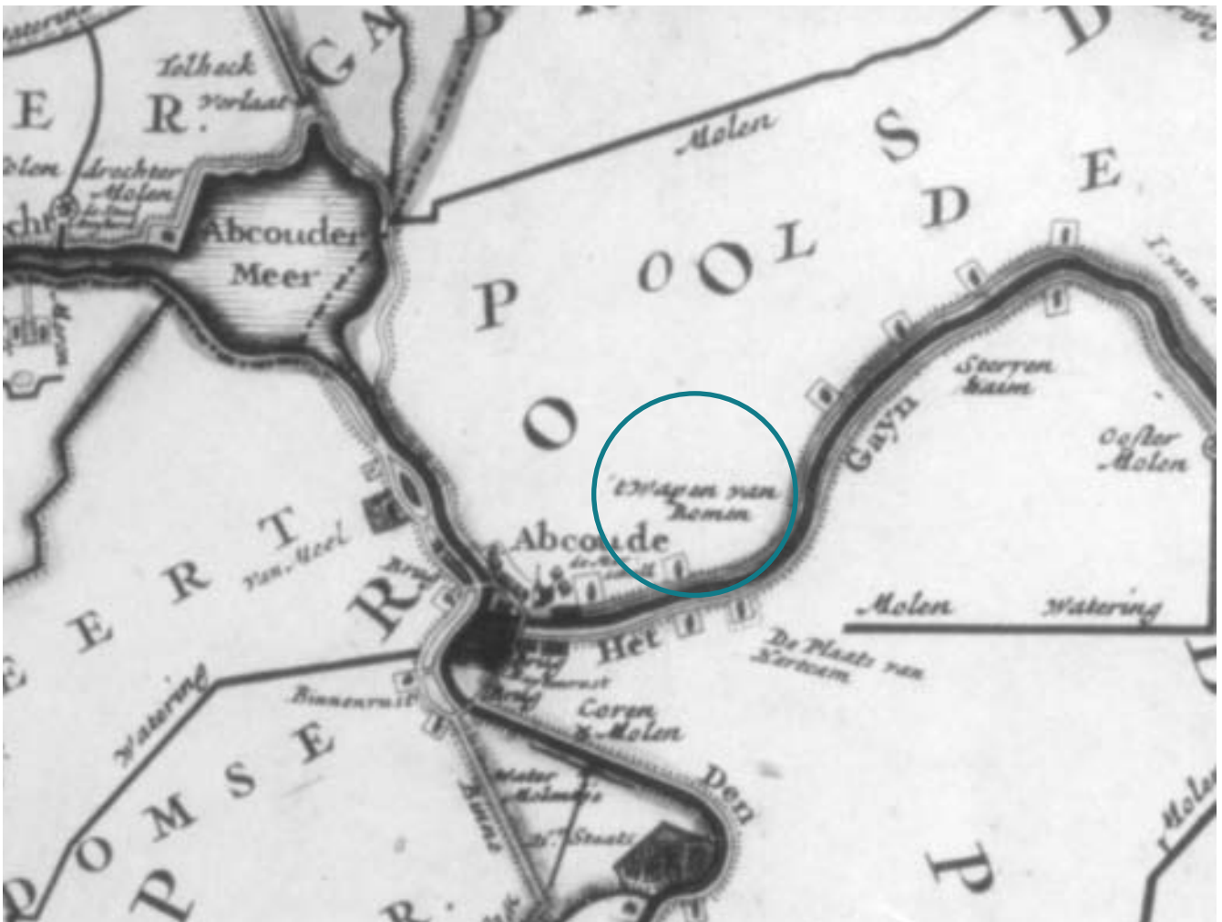
Op deze oude kaart wordt de boerderij Groot Rome als 't Wapen van Rome aangegeven