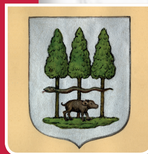
Wapen van Wilnis [1816]