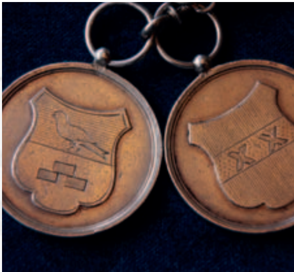
Twee penningen aan de ambtsketen van Vinkeveen en Waverveen