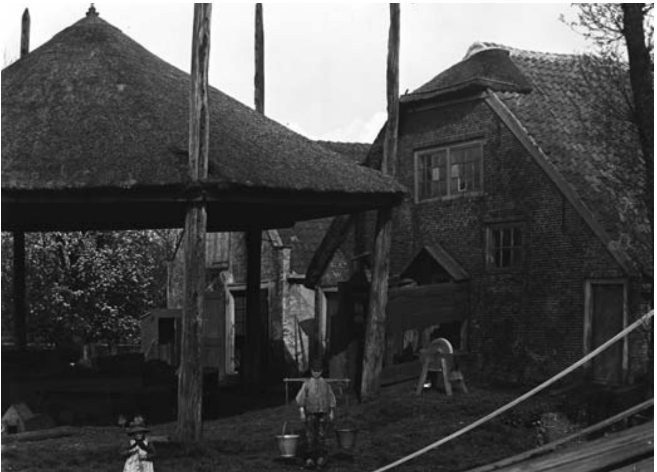
De achterzijde van de boerderij Groot Rome