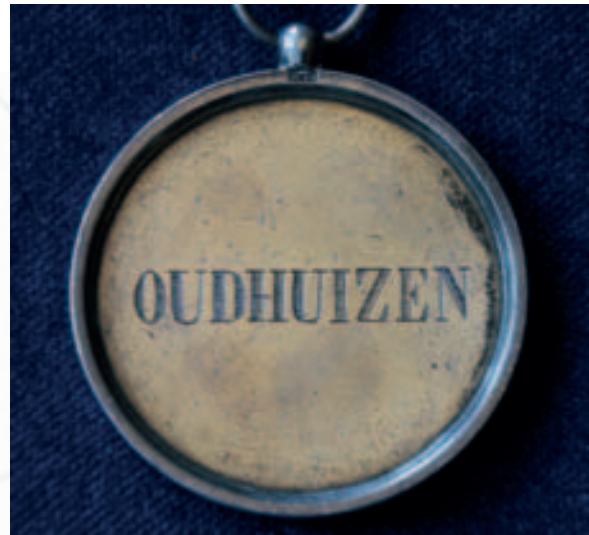
De penning aan de amtsketen van Oudhuizen

dat in het schildje van het gemeentewapen de afbeelding van het Lam Gods foutief was weergegeven en dat aan de andere zijde het rijkswapen er niet op was afgebeeld. In de archieven van de diverse gemeenten is weinig over de aanschaf of vernieuwing van de amtsketens te vinden. Wel is duidelijk dat de kosten vaak een belangrijke rol speelden. In het Provinciaal-Blad van Utrecht van 4 december 1852 delen de gouverneur en de griffier van de provincie mede tussenkomst te willen verlenen bij de aanschaf van de penningen. De graveurs van 's rijks munt zijn bereid de penning te leveren tegen tien gulden wanneer de gemeente een wapen heeft en tegen zes gulden indien alleen de naam van de gemeente moet worden vermeld. In dit schrijven worden de gemeenten tevens geadviseerd om de aanschaf te laten geschieden uit de gemeentekas vanwege het feit dat de kosten voor diverse burgemeesters, gezien de lage bezoldiging wel eens bezwaarlijk zouden kunnen zijn.