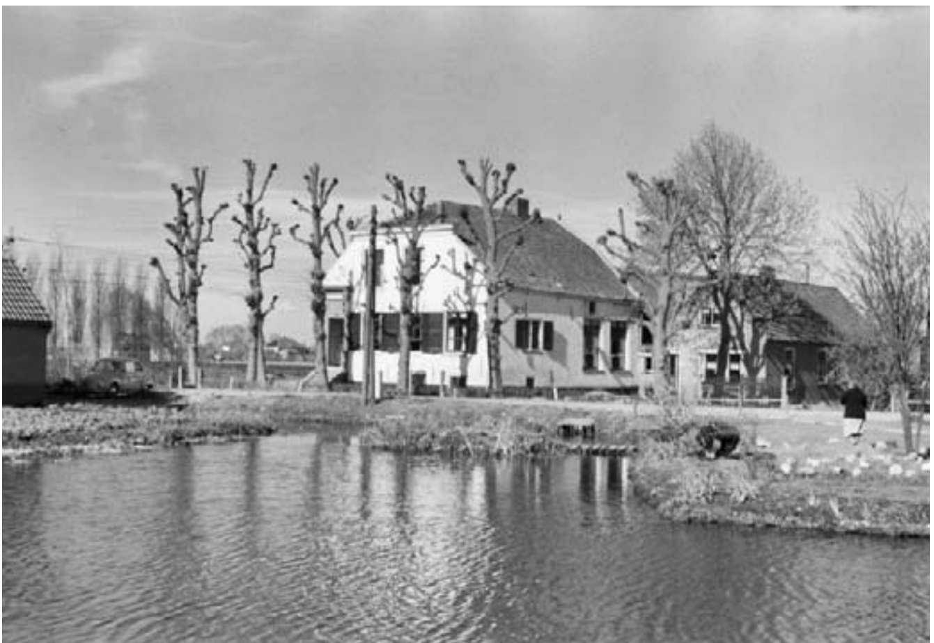
De boerderij Groot Rome gezien vanaf Gein-Zuid

Bij een bezoek aan Gerrit (Ed) van Diest wist hij mij toch nog wat informatie over Groot Rome te geven. Door de vroegere opsplitsing was het een klein boerenbedrijf met circa 15 koeien, schapen, kippen, varkens en één paard. De melk werd in bussen dagelijks opgehaald door v.d. Marel, een melkrijder die zijn bedrijf ook in het Gein had. Het vee werd geslacht door v.d. Bosch die in de Waterlelie woonde. Onder het oude voorhuis zat een grote kelder met een pekelbak waar het vlees in opgeslagen werd. Onder de ruime gang lag een grote watertank met een handpomp. Met de komst van de spoorlijn werd het land in tweeën gedeeld en de grond van het kerkhof behoorde daar ook bij. Maar het grootste gedeelte grond lag achter de boerderij. De koeien werden los over het spoor tussen de rijtijden van de treinen van het ene naar het andere land verplaatst.