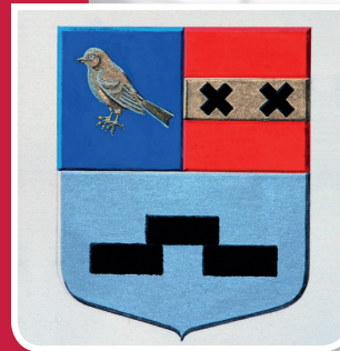
Wapen van Vinkeveen en Waverveen [1972]

Nadat in 1868 een groot aantal waterschappen in deze regio fuseerde tot het 'Grootwaterschap der Ronde Veenen', werd het in 1924 hernoemd tot 'Grootwaterschap De Ring der Ronde Venen'. Het kreeg ook een eigen wapen. In dat wapen herkennen we het Mijdrechtse Lam Gods, de drie bomen van Wilnis, de vink van Vinkeveen en de drie zuilen van Abcoude Baambrugge. Dit wapen leverde de inspiratie op voor het nieuwe wapen van de huidige gemeente De Ronde Venen. Op het blazoen van het wapenschild staan de verschillende elementen van de oude gemeentewapens. In het schildhoofd staat het Lam Gods van het wapen van Mijdrecht. De vink in de schildvoet komt uit het wapen van Vinkeveen, de slang komt uit dat van Wilnis. De sleutels komen uit het wapen van Abcoude-Proosdij en de zuilen uit het wapen van Abcoude Baambrugge. Het schild wordt gedekt door een gouden kroon van drie blade- ren en twee parels.