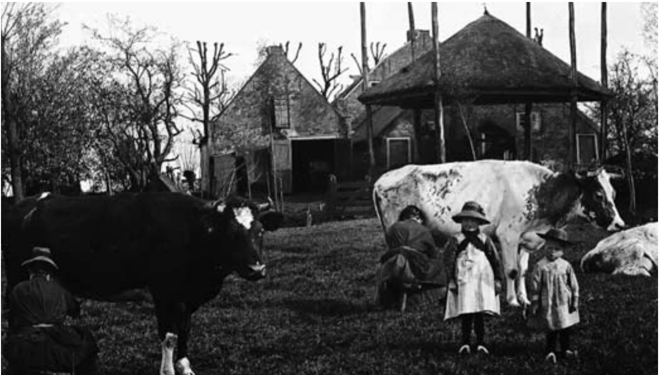
Koeien melken achter de boerderij Groot Rome

Het dak van de stal bestond aan de spoorlijnzijde uit bedekking van dakpannen en de andere zijde had nog een rieten dakbedekking.