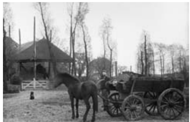
De boerderij Groot Rome met op de achtergrond het station van Abcoude