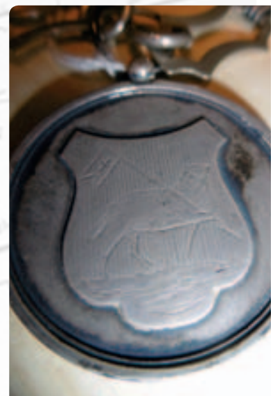
Penning aan de amtsketen van Mijdrecht van omstreeks 1895

Opmaak: Jaco Kroon, Pijl14 grafisch ontwerp