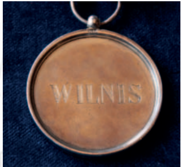
De penning aan de ambtsketen van Wilnis

verstaan. Wanneer de burgemeester verhinderd is, moet de keten gedragen worden door degene die hem of haar vervangt.