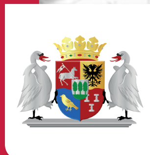
Wapen van het Grootwaterschap De Ring der Ronde Venen [1924]