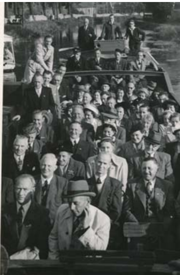
De genodigden in de veeboot

in „Het Amsterdamsche Koffiehuis“ waar het gemeentebestuur receptie hield. Er was een goede stemming zoals dat in watersportkringen voorkomt, die tot in de avond duurde. De Abcouder Harmonie kwam toen de talrijke gasten halen om met de sportclubs van Abcoude een fakkeloptocht door het dorp te houden. Hierna volgde een tuinfeest in de tuin van „De Eendracht“. De fraai in beton uitgevoerde brug is door de Amsterdamse Ballast Mij. gebouwd. Er zijn twee openingen. Oorspronkelijk was er één geprojecteerd maar bij het ontwerpen werd op verzoek van de Commissie voor de Vecht en Abcoude's Belang in een vriendelijk overleg met de Rijkswaterstaat overeengekomen, dat er twee openingen werden gemaakt. Hier volgen nog enige maten: Bij waterstand 0.40 N.A.P.: diepte vaargeul 2.10 m, breedte van de koker 6.70 m, lengte 31 m. Het was nu weer mogelijk de kleine route te varen via Holendrecht-Abcoudermeer-Gein en Gaasp en de grote route over Abcoude, Angstel naar Nieuwersluis de Vecht terug naar Amsterdam. Het is verheugend, dat deze wateren, die in de lange rustperiode ernstig zijn dichtgegroeid, grondig zullen worden schoongemaakt. Vooral de middenstand heeft