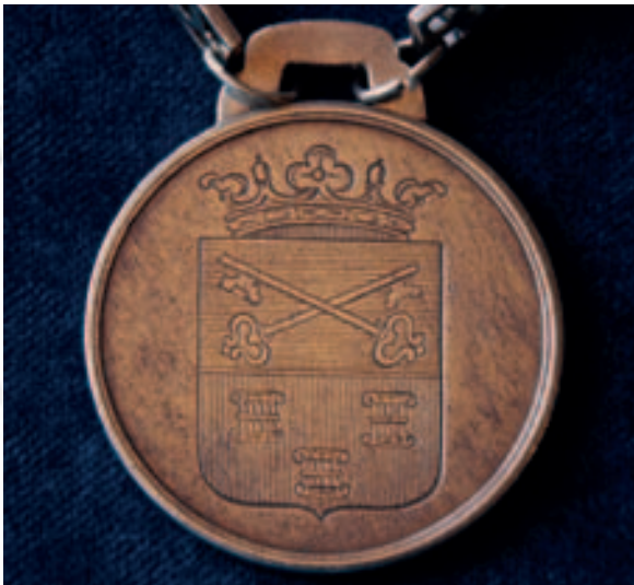
De penning aan de amtsketen van Abcoude