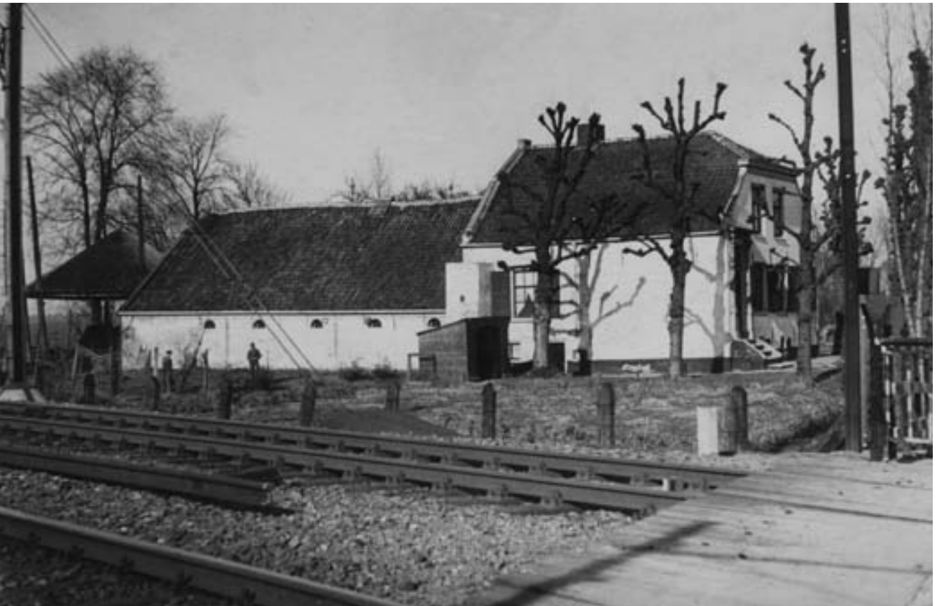
Groot Rome gezien vanaf spoorwegovergang