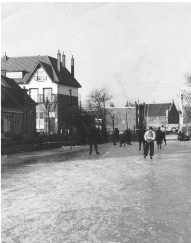
Schaatstoerisme op de Angstel bij de Hulksbrug

In 1953 werd er een eerste vergadering belegd met de omliggende Ijsclubs in de "Wakende Haan" en werd de Samenwerkende Ijsclubs in het Angstel- en Plassengebied een feit. In 1954 mocht er niet meer op de Fortgracht geschaatst worden in verband met militaire overwegingen.