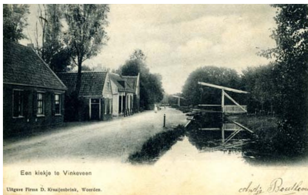
Een kiekje te Vinkeveen; Uitgave Firma D. Kraaijenbrink, Woerden

Het resultaat was dat in overleg een compromis