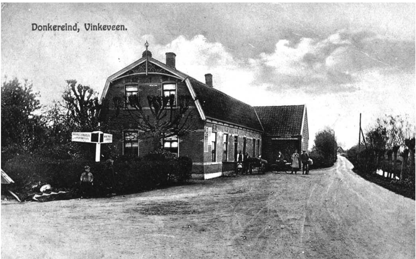
De Schans aan de Uitweg richting Wilnis, links Donkereind