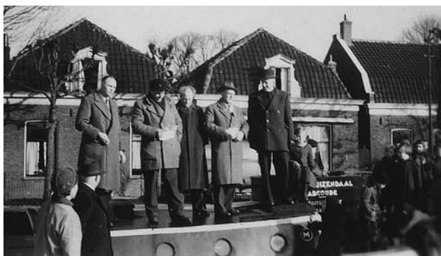
Wedstrijdleiding Abcouder IJclub bij wedstrijden op de Angstel aan de Molenweg