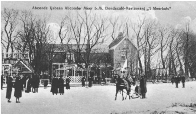
Abcoude Ijsbaan bij 't Meerhuis