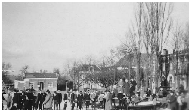
Start wedstrijd op de Angstel aan de Molenweg. De ijsclub was weer opgekrabbeld na de oorlogsjaren