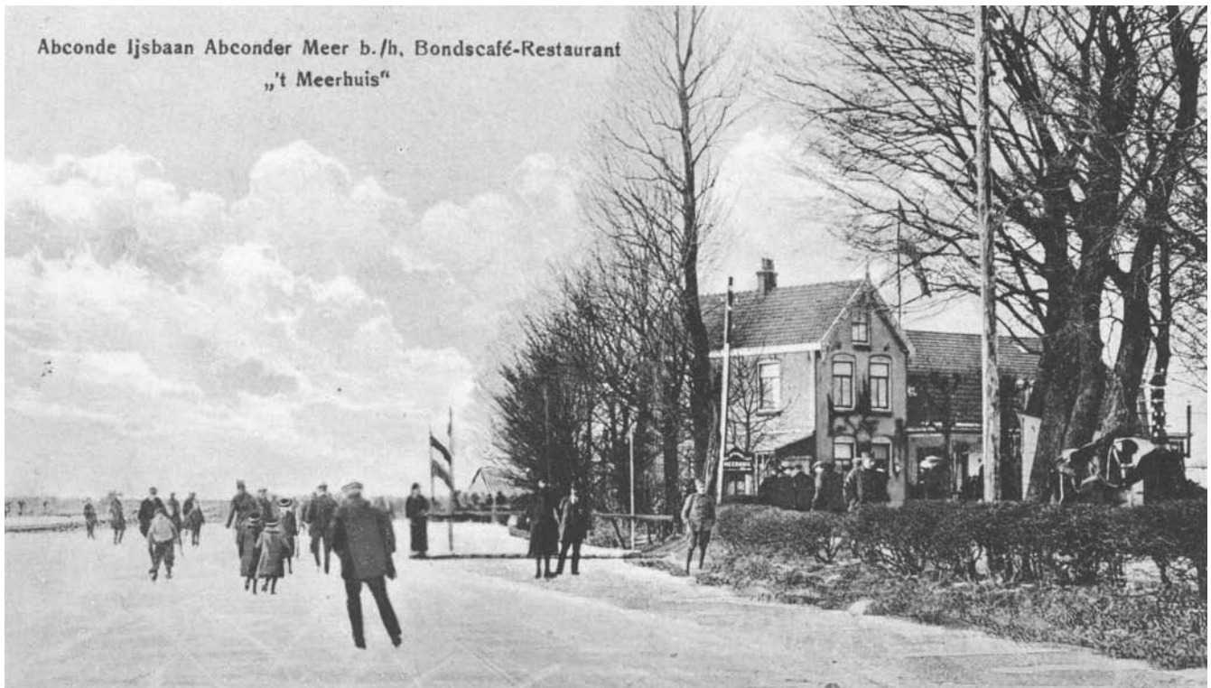
Ijspret op het Abcoudermeer bij 't Meerhuis