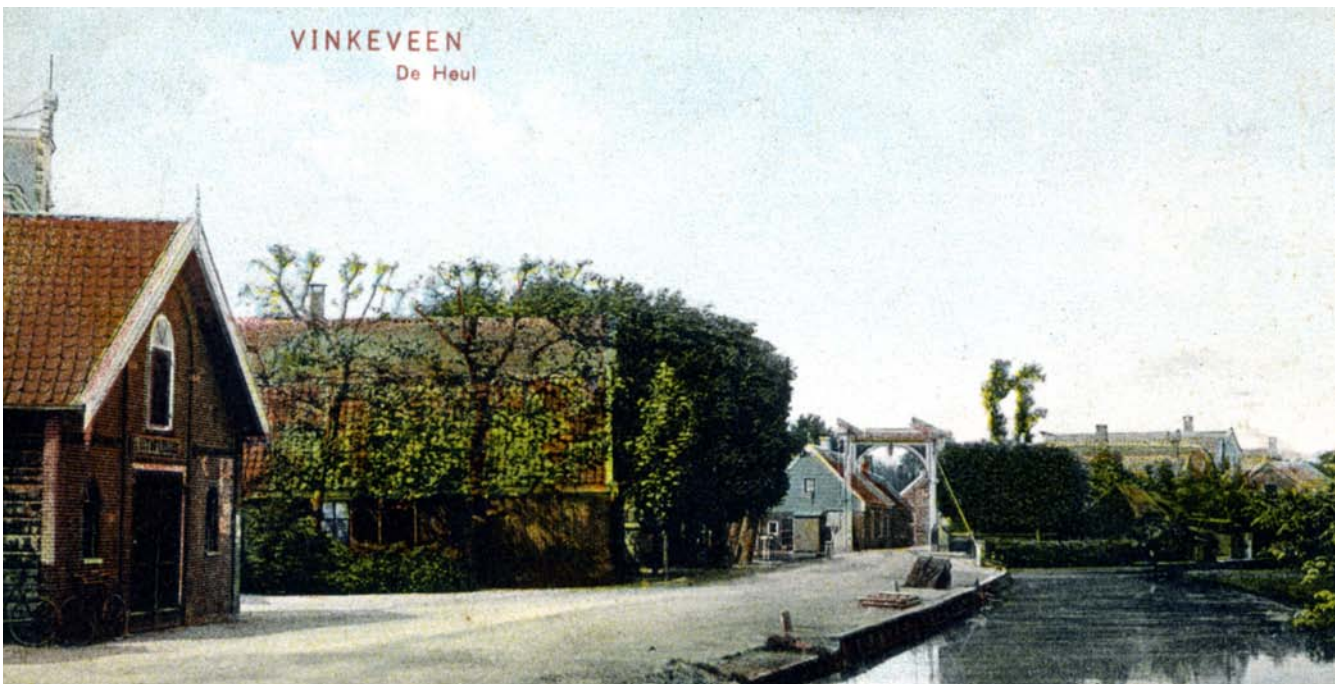
Demmerik met zicht op de Heul

De functie van ambachtsheer was in de turbulentie van de Bataafse revolutie afgeschaft als niet democratisch, maar bij het herstel van de democratie in 1813 weer ingevoerd. Bij de grondwetwijziging in het jaar 1848 wordt de Ambachtsheer voor altoos naar een plaatsje in de geschiedenis boekjes verwezen.