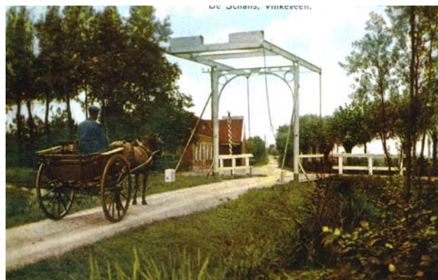
Ter Aase Zuwe op de kruising met Donkereind links en Demmerik rechts

Censuskiezers kozen hier per district een kiescollege, dat de Statenleden aanwees.