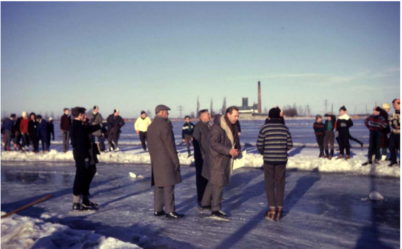
Schaatswedstrijden voor de jeugd op het Abcoudermeer met op de achtergrond de Motex winter 1961/1962

van de gemeente te huren. Dit winterseizoen was er geen ijs. Op 16 november 1960 werd Dr. Wiersma gekozen tot voorzitter en kreeg de ijsclub toestemming om de rolbezem van de gemeente te gebruiken.