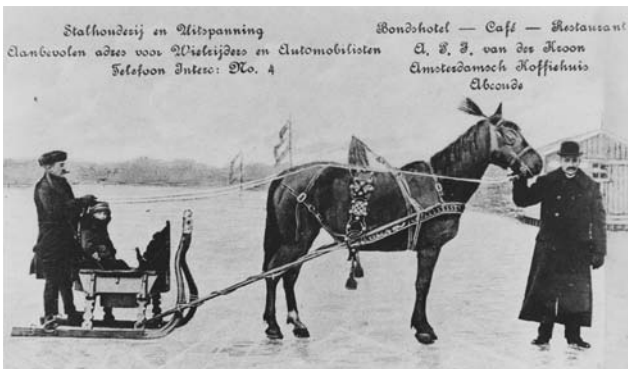
Arrenslweedstrijd op het Abcoudermeer met een van de prijswinnaars