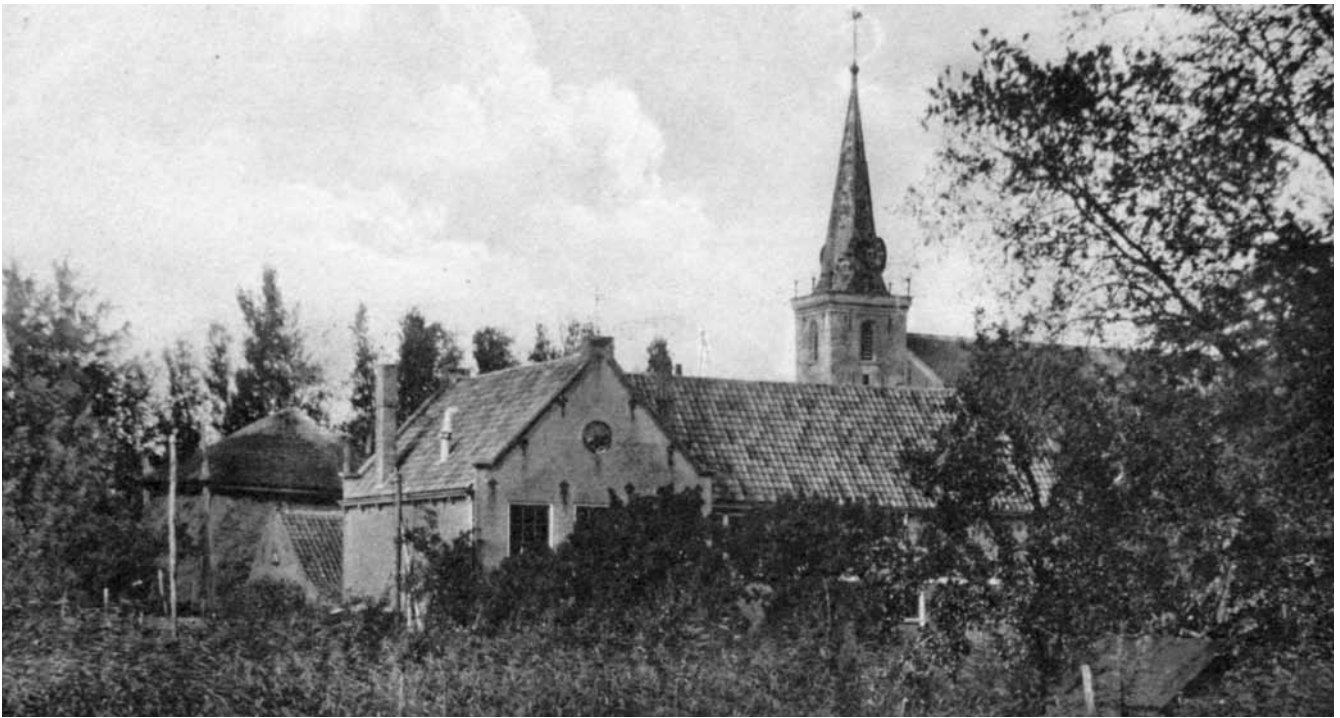
De openbare school in Baambrugge, niet lang voor de sloop

Al gauw bleek dat hij een onderwijzer in hart en nieren was. Ondernemend, onderhoudend en punctueel. Hij genoot van de kinderen en van de mensen om hem heen. Zijn moeder kwam uit een familie waar alle gezinsleden onderwijzer waren. Het ligt voor de hand dat hij zijn voorliefde voor het onderwijs door haar meegekregen.