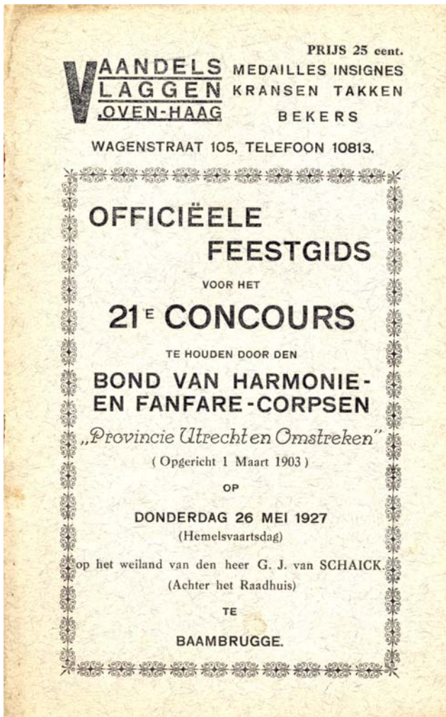
Programmaboekje van het 21e concours

ook geruild worden. Met veel inzet en weinig middelen heeft hij een compleet fanfare- en harmonieorkest geformeerd.