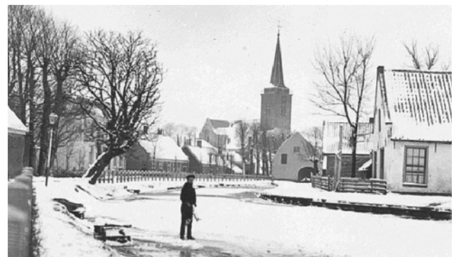
Winterbeeld van de Angstel ter hoogte van het Amsterdams Koffiehuis

Door zich als ijsclub aan te sluiten bij de Stichtsche Ijsbond, (opgericht in 1907 te Utrecht) kreeg men een betere aansluiting op de regio en werden een paar keer bondstochten georganiseerd. Ook probeerde men vaarverboden in te stellen, maar dat lukte niet erg. Enkele burgemeesters