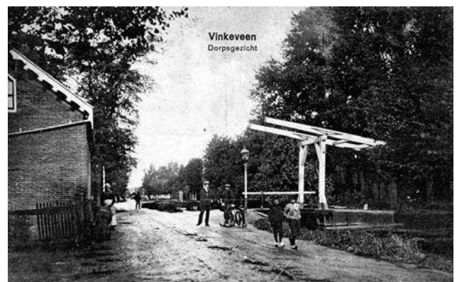
Herenweg nabij de Zuwe