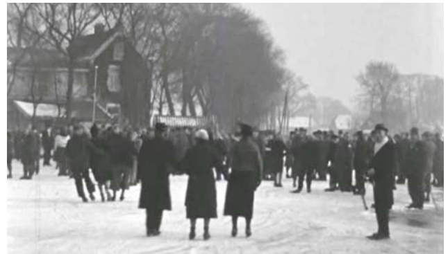
Ijstoerisme op de Angstel bij 't Meerhuis