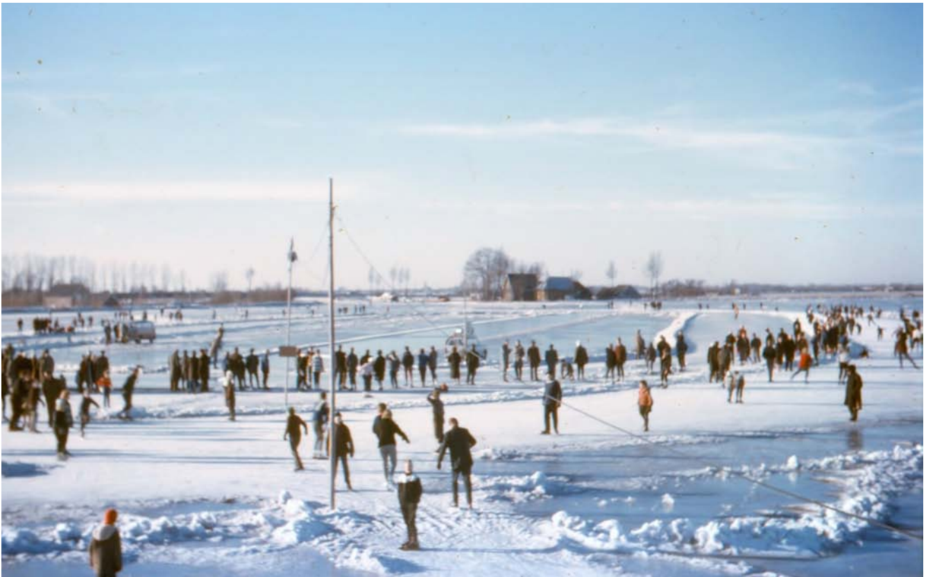
Wedstrijd baan op het Abcoudermeer in de strenge winter van het seizoen 1962/1963