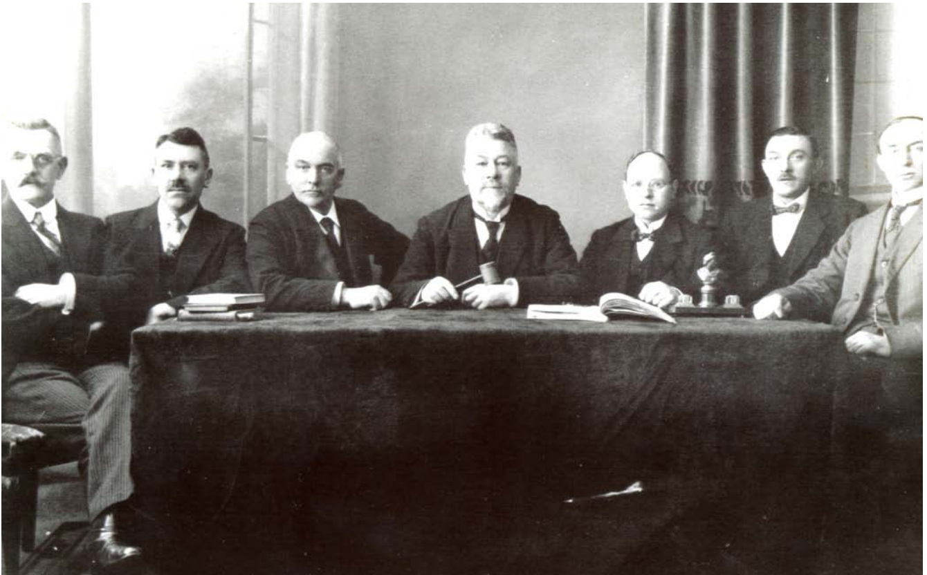
Meester Dokkum met de voorzittershamer