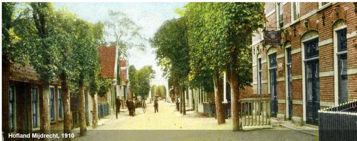
Hofland Mijdrecht, 1910

HISTORISCHE VERENIGING De Proosdijlanden