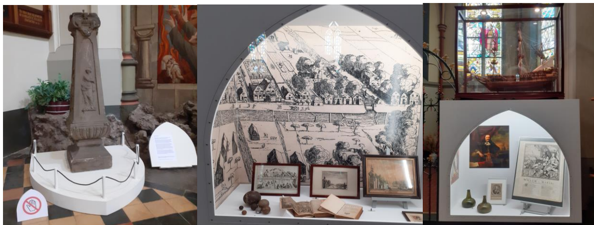
De zonnewijzersokkel, de Waverveenvitrine en de vitrine 'Frennemies'

Het aantal bezoekers is vanaf 1 juli al gegroeid tot bijna 400. Alleen al op deze woensdag kwamen een kleine honderd personen de expositie over 1672 bekijken. En net als bijna elke andere bezoeker met heel veel waardering voor het gebodene.