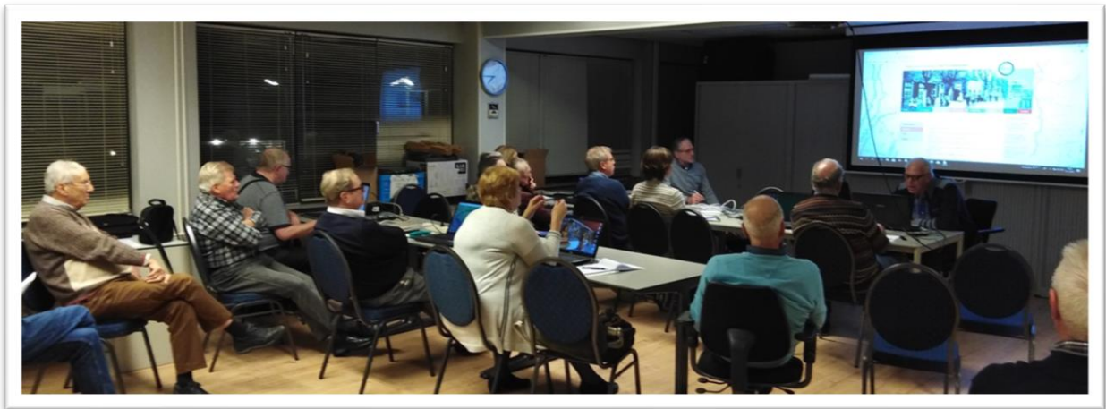
Lezing tijdens een bijeenkomst van de werkgroep Genealogie.

De helpdeskavonden zijn voor iedereen toegankelijk; daarvoor hoeft u niet per se lid te zijn van de historische vereniging. En ook belangrijk: vergeet vooral niet uw laptop mee te nemen.